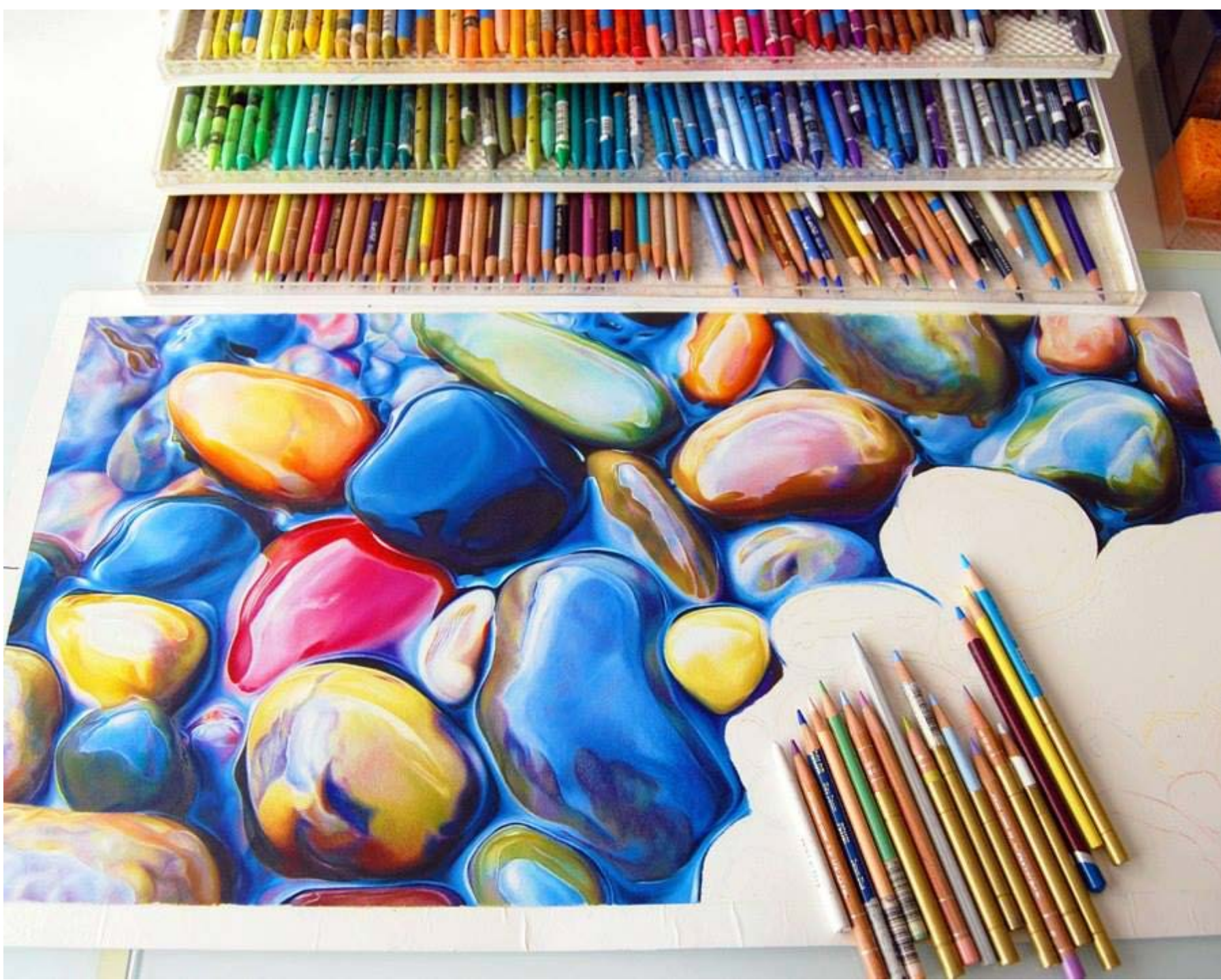
Рабочее место художницы