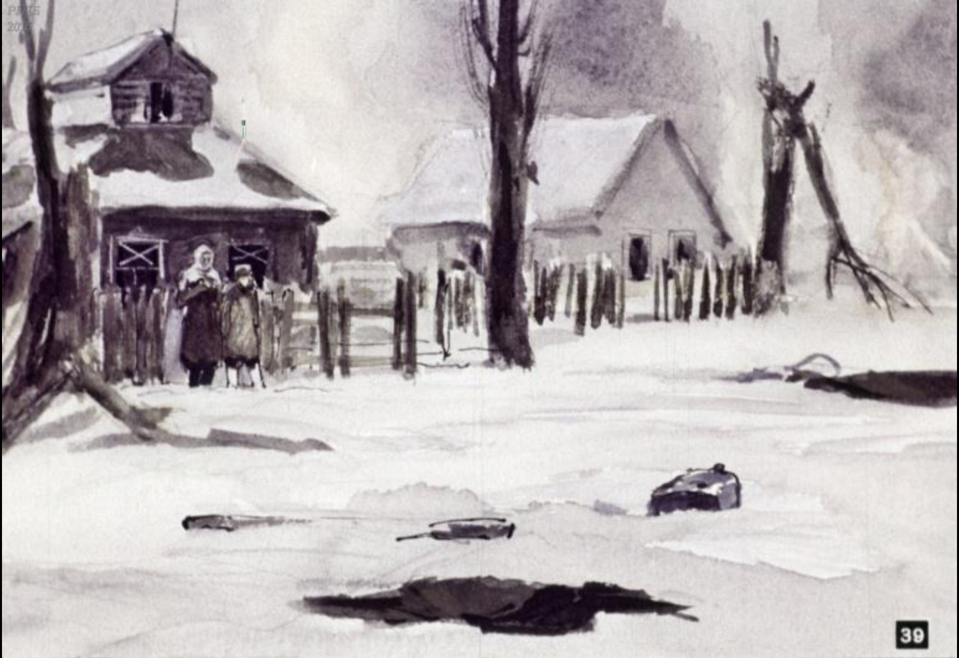
Ещё издали он увидел у калитки женщину и мальчика.