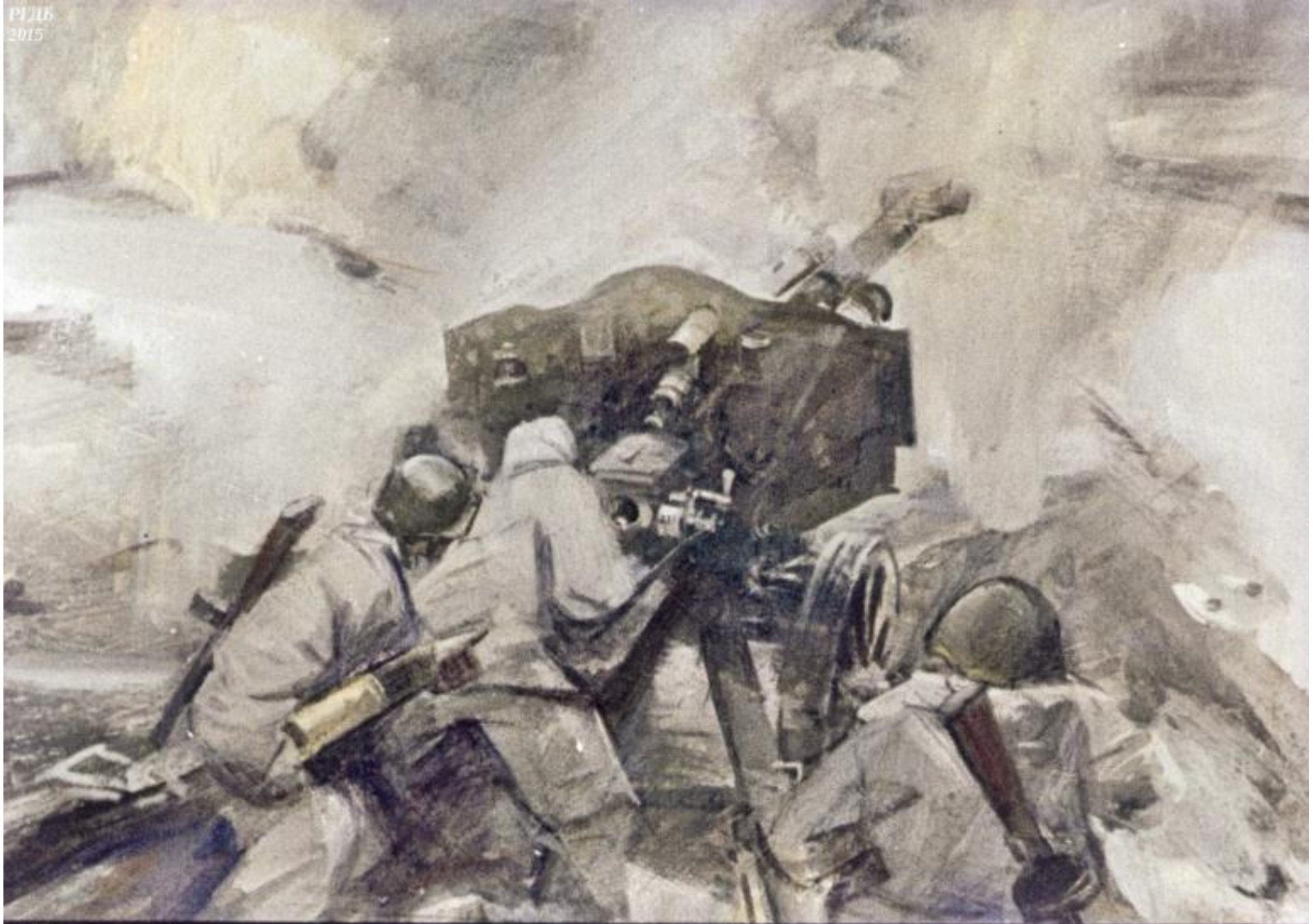
Гвардейцы тут же развернули орудия и ударили по фашистам. 24