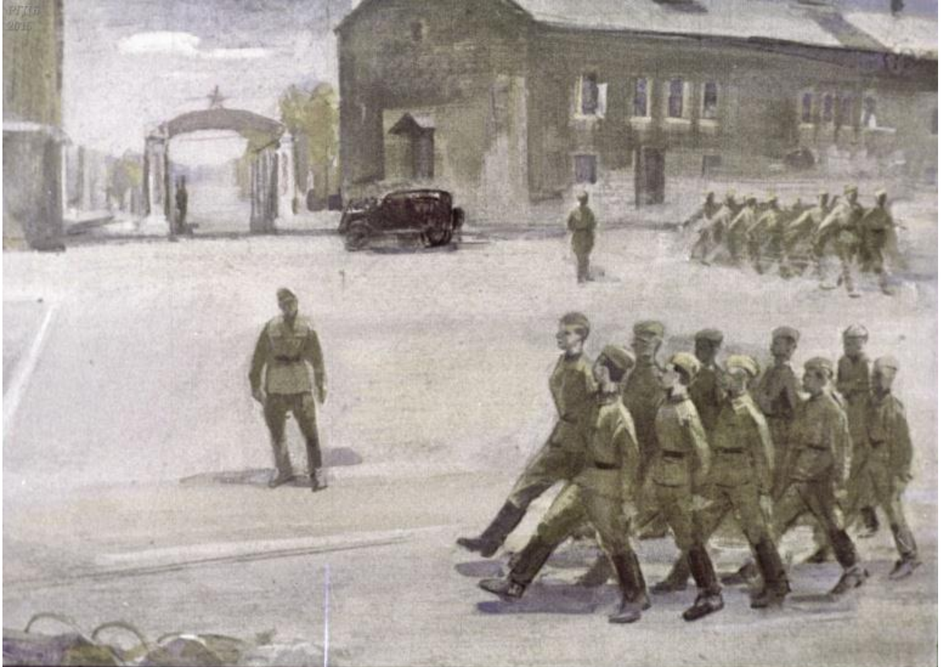
Сашино отделение марширвало на плацу,