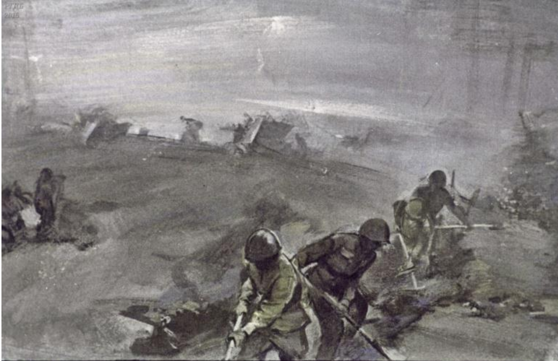
Перед самым рассветом курсанты подошли к передовой линии. Они поставили на место пушки, замаскировали их ветками, принялись копать укрытия.