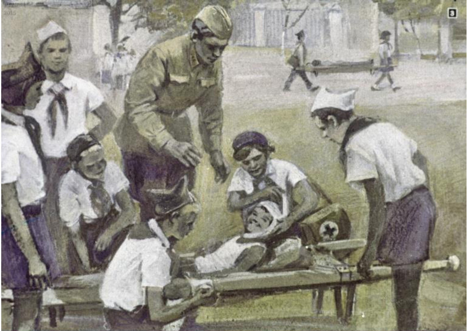
а в школах мальчики и девочки учились перевязывать раненых.