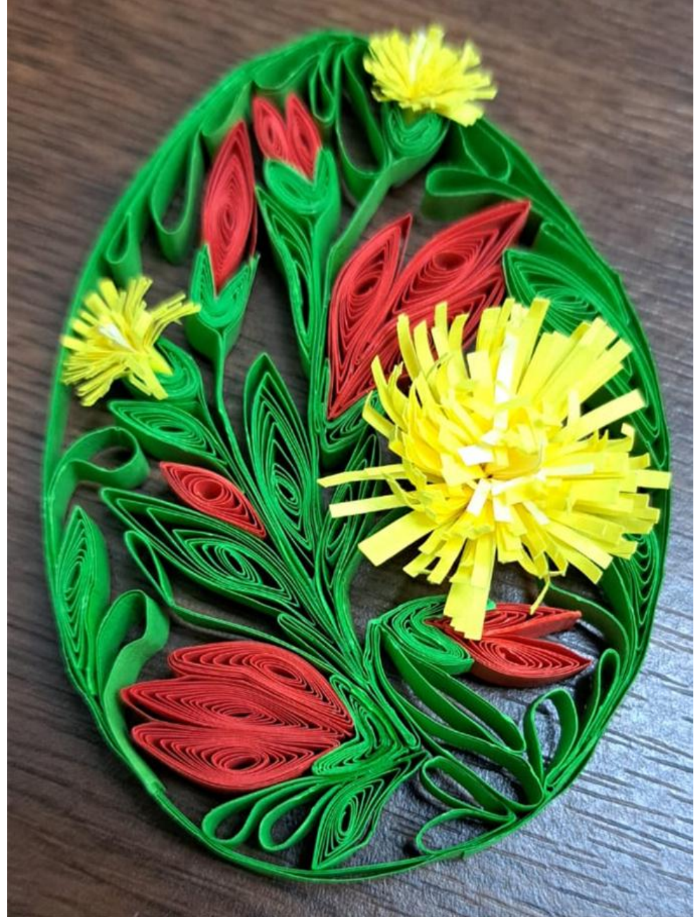
«Пасхальные узоры» в технике «квиллинг»