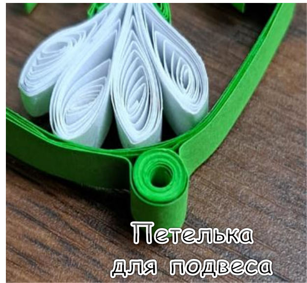
Петелька для подвеса

Из зеленых полосок бумаги формируем овал, проклеиваем несколько слоев полосок для прочности. Приклеиваем цветы к овалу изнутри. Скрепкой скручиваем плотную «петельку» для подвески, приклеиваем ее сверху. Проклеиваем по контуру овала еще 2 - 3 зеленые полоски, чтобы лучше зафиксировать петлю.